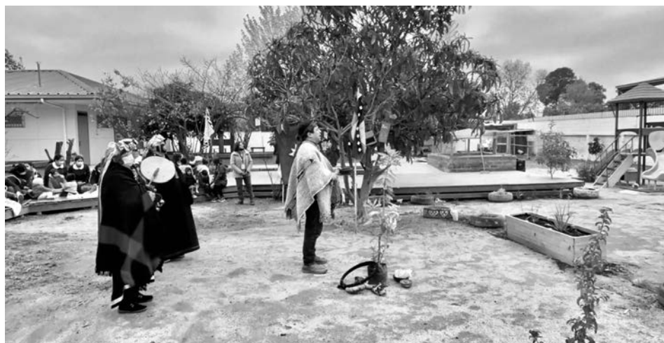
Imagen 12. Jardín Infantil Inti Raymi Nota. Fotografía del centro educativo

Pero sí siento que es la diversidad es algo que, lo que te decía, que todos somos parte, que la podemos ver, vivir en cada una de las personas o de los que convivimos el día a día y que se puede mostrar en distintas formas o la podemos evidenciar de distintas formas, cultural, a través de lo que vamos viviendo con una interacción con el otro (Entrevista Educadora).