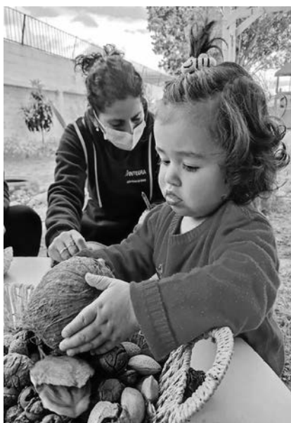
Imagen 1. Jardín Infantil Inti Raymi