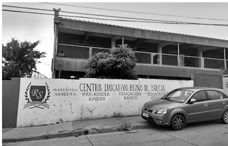
Imagen 1. Frontis Centro Educativo Reino de Suecia