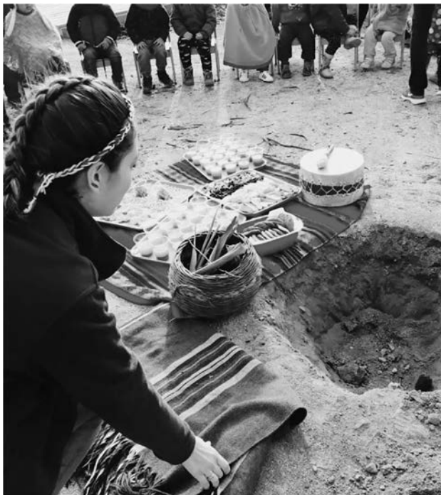
Imagen 2. Ceremonia, Jardín Infantil Inti Raymi

Otra de las adaptaciones curriculares que se decide implementar en el jardín infantil el año 2015 es la creación de la sala de práctica psicomotriz , que nace por la necesidad de las familias y el equipo por conceder un espacio donde los niños y las niñas, de manera libre y a través del juego, puedan desarrollar sus habilidades psicomotoras, respetando y valorando los procesos de aprendizaje de cada uno, basado en los postulados de Bernard Aucouturier (2015).