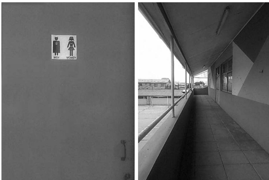
Imagen 6 y 7. Puerta del baño y pasillo, Centro Educativo Reino de Suecia

De acuerdo al PEI, la inclusión y la formación académica son elementos relevantes para el establecimiento como escuela pública, entendiendo la inclusión como el respeto por las características de cada estudiante, dando énfasis en los apoyos personalizados que puedan darse por parte de la comunidad, es decir, trasciende lo cognitivo.