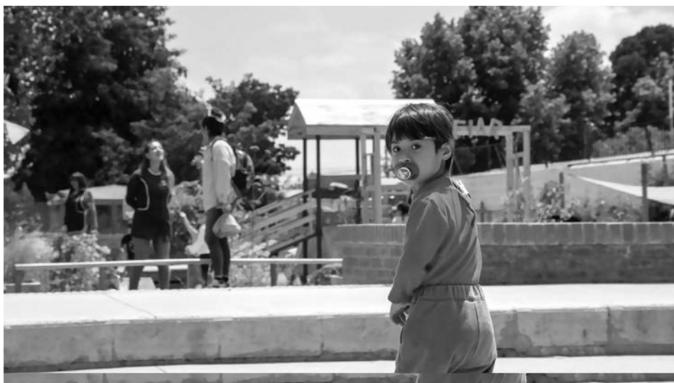
Imagen 8 y 9. Equipo y zona del patio, Jardín Infantil Inti Raymi