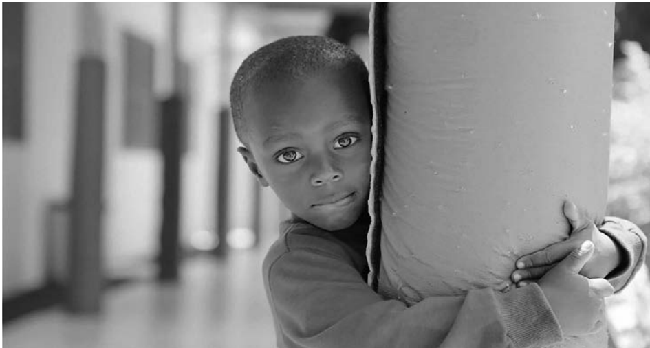
Imagen 5. Estudiante, Jardín Infantil Inti Raymi

Esta visión, además, se alinea con el marco curricular que releva en su propuesta educativa, basándose en referentes filosóficos-pedagógicos, como la mirada Aucouturier (2015) de la psicomotricidad que sitúa al niño/a/e como un sujeto indivisible mente-cuerpo-emociones, que debe tener plena libertad de movimiento y visualización, siendo consciente y protagonista de su ser indivisible. También plantean como referente el curriculum Montessori (Britton, 2011) con todo su relevo de los ritmos singulares de aprendizaje y un ambiente y actividades educativas, pensadas desde la autonomía y autorregulación de los infantes, siendo el adulto un mediador y acompañante de sus procesos educativos. A su vez, cobra vital relevancia su propuesta metodológica en los niveles de salas cunas desde el referente de Emmi Pliker (2010), quien sitúa al movimiento libre de los lactantes como crucial para su adecuado desarrollo psico-motor, respetando las posturas y el acompañamiento del adulto en los trascendentales hitos de su desarrollo.