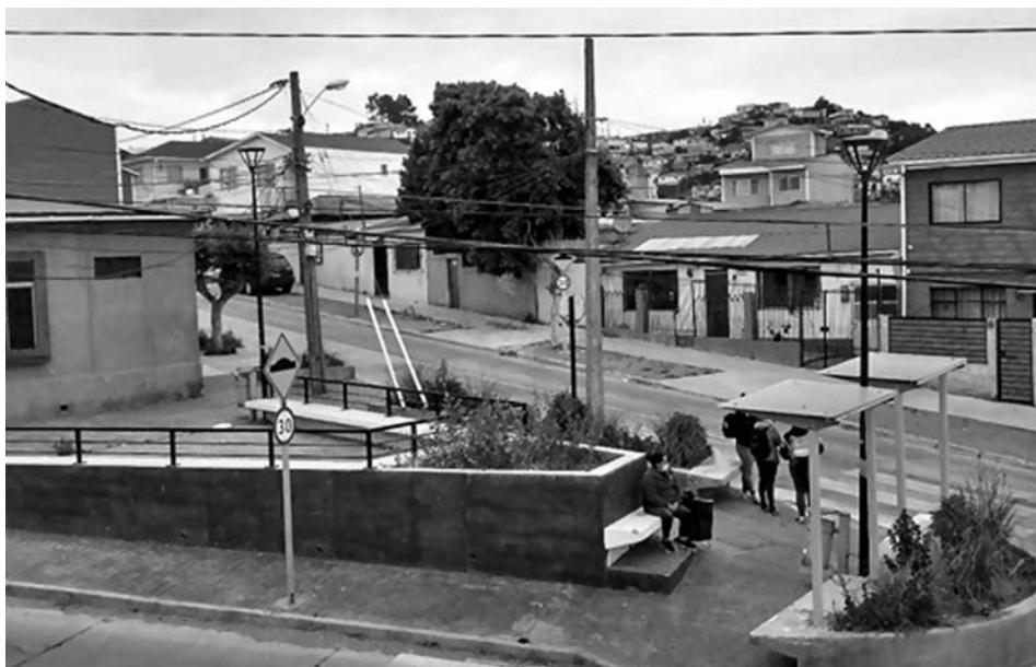
Imagen 9. Alrededores Centro Educativo Reino de Suecia

En la misma línea, la escuela no sólo está abierta a la comunidad, sino que también contribuye con ella de distintas formas, por ejemplo, colaborando con la rehabilitación y limpieza de los espacios públicos cercanos, como la plaza frente al centro.