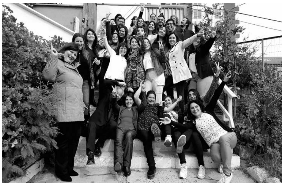
Imagen 2. Equipo Escuela Ciudad de Berlín