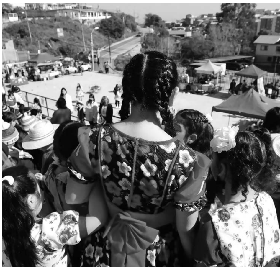
Imagen 1. Escuela Ciudad de Berlín Nota. Fotografía del centro educativo

nología en el aula (proyector, computador, telón), sala audiovisual y cancha para deportes. Entre las actividades deportivas que se ofrece al estudiantado sobresale: baby fútbol, básquetbol, gimnasia artística-rítmica, tenis de mesa, ajedrez y balonmano. Precisamente esta última actividad es reconocida con gran orgullo, pues si bien la comunidad educativa no cuenta con los recursos óptimos para su desarrollo, han obtenido el segundo lugar en distintos campeonatos frente a otras escuelas que sí se enfocan en dicho deporte. Cabe destacar, que la escuela ofrece diversos talleres extraprogramáticos que se adecuan a las demandas y opinión de los estudiantes y, por tanto, pueden variar año a año.