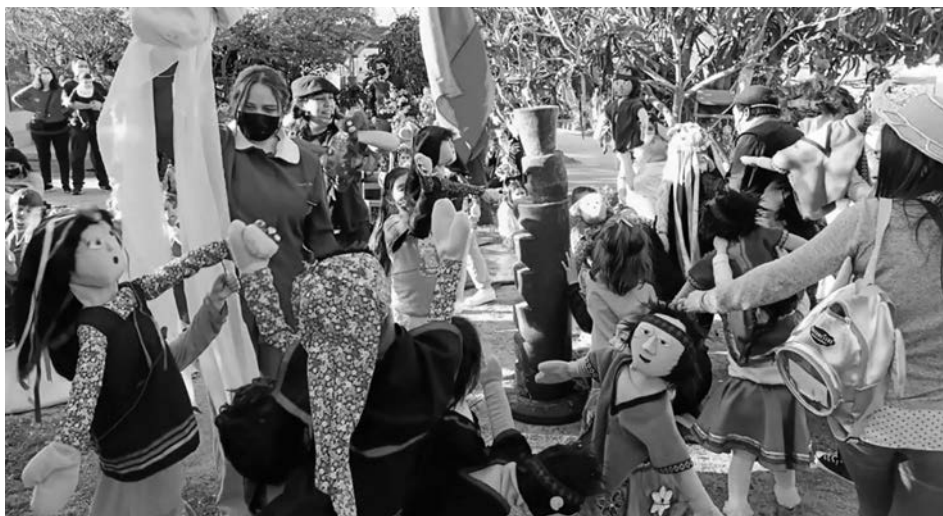
Imagen 11. Jardín Infantil Inti Raymi

Nuestro proyecto educativo hoy día habla desde la diversidad, yo creo que eso creo que hace, porque en vez de la inclusión y la interculturalidad también, es que es un todo, porque finalmente todos somos muy diversos. Yo creo que eso hace y por lo menos a mí en la vida creo que me ha servido para entenderlo más, porque finalmente, claro, podemos hablar de la palabra inclusión, pero si habláramos de diversidad sería todo mucho más fácil, porque finalmente todos entendemos que todos somos distintos y todos aportamos de distinta forma, todos tenemos culturas distintas, culturas familiares, formas de creer, necesidades distintas también. Entonces yo creo que eso para mí por lo menos del proyecto educativo lo que quizás hago propio es como desde ahí, de la diversidad, lo importante que es entender la diversidad también (Entrevista Educadora).