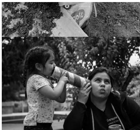
Imagen 15 y 16. Jardín Infantil Inti Raymi Nota. Fotografías del centro educativo