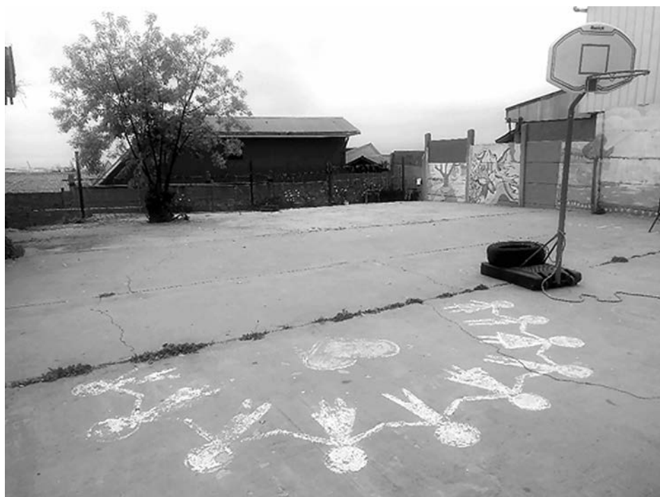
Imagen 8. Patio, Centro Educativo Reino de Suecia