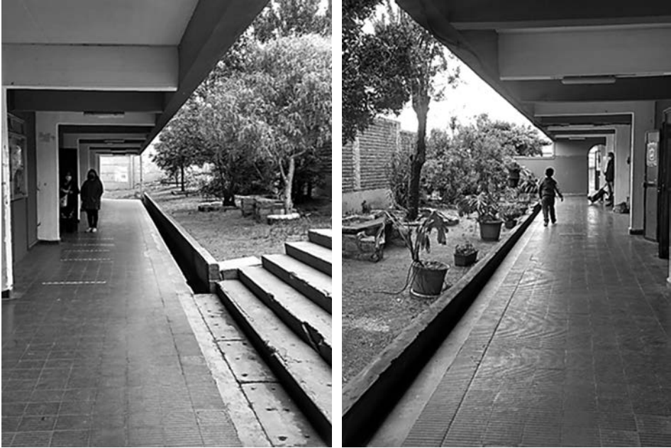
Imagen 3 y 4. Pasillos de entrada, Centro Educativo Reino de Suecia