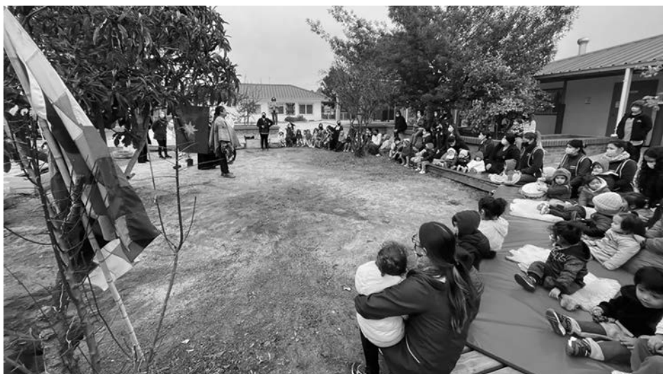
Imagen 14. Jardín Infantil Inti Raymi

Creo que nunca hemos dejado de reflexionar sobre nuestras prácticas, sobre buscar otras ideas, sobre poder reinventarnos muchas veces. Hoy día que tenemos otras condiciones, un equipo más comprometido, en que todas, de cierta forma, dicho coloquialmente, remamos para el mismo lado. Creemos en la misma educación (Entrevista Educadora).