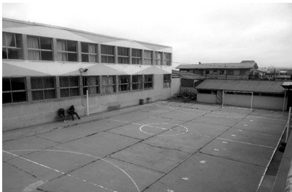
Imagen 2. Centro Educativo Reino de Suecia, patio central