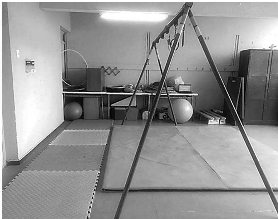
Imagen 5. Centro Educativo Reino de Suecia

Para la cantidad de estudiantes, las salas y espacios que posee el establecimiento son cómodas para quienes las utilizan, mientras que respecto al mobiliario “su estado no es el mejor, y en algunos casos, urge una renovación” (PEI, 2021, p.7), pero cuentan con los materiales y recursos necesarios para las clases, como también para los apoyos que necesite el estudiantado, como la sala de terapia o el Centro de Recursos del Aprendizaje (CRA).