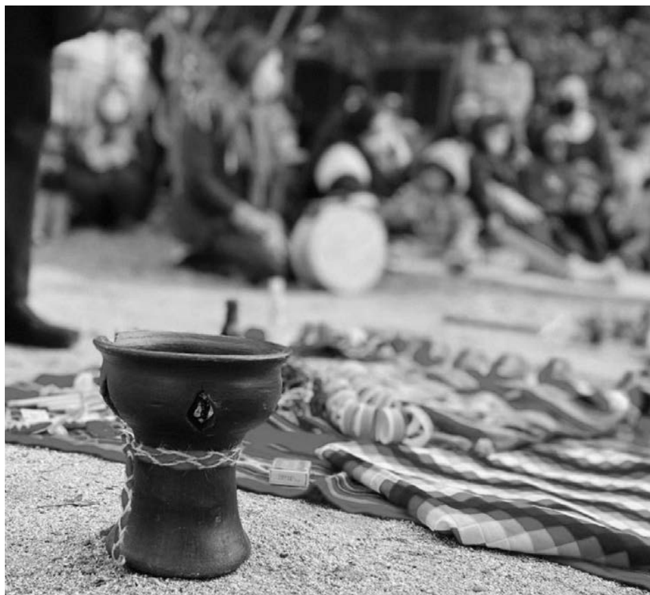
Imagen 3. Ceremonia, Jardín Infantil Inti Raymi

Raymi significa fiesta así que nos llama un poco todos los días a que esto sea un espacio de juego, de baile, de música, de bastante alegría, de comunidad también, que tiene mucho sentido, Inti Raymi es una celebración comunitaria (Entrevista Educadora).