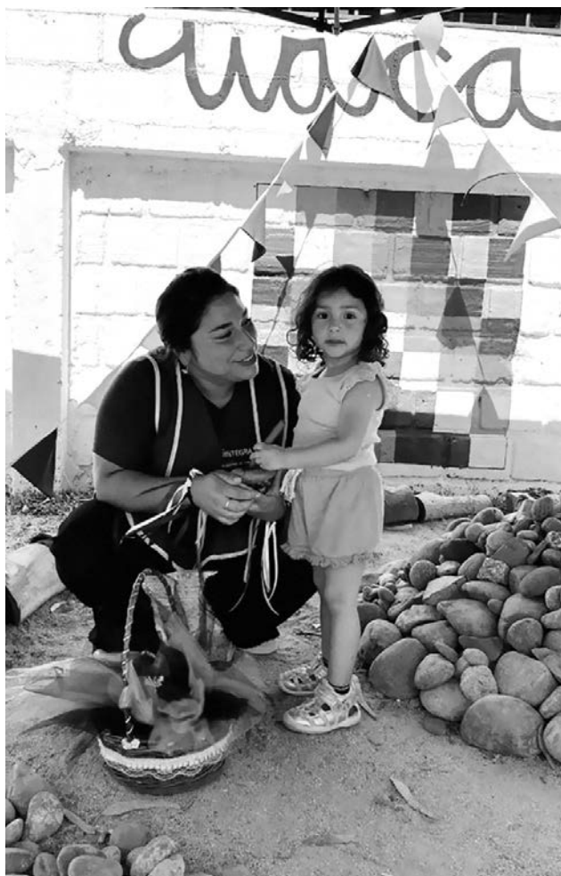
Imagen 7. Jardín Infantil Inti Raymi Nota. Fotografía del centro educativo

A su vez, esta mirada democrática de la construcción y transformación permanente del currículum, conlleva a involucrar -por medio de diversas estrategias de participación- la voz de las familias y de todas las infancias protagonistas dentro del centro educativo.