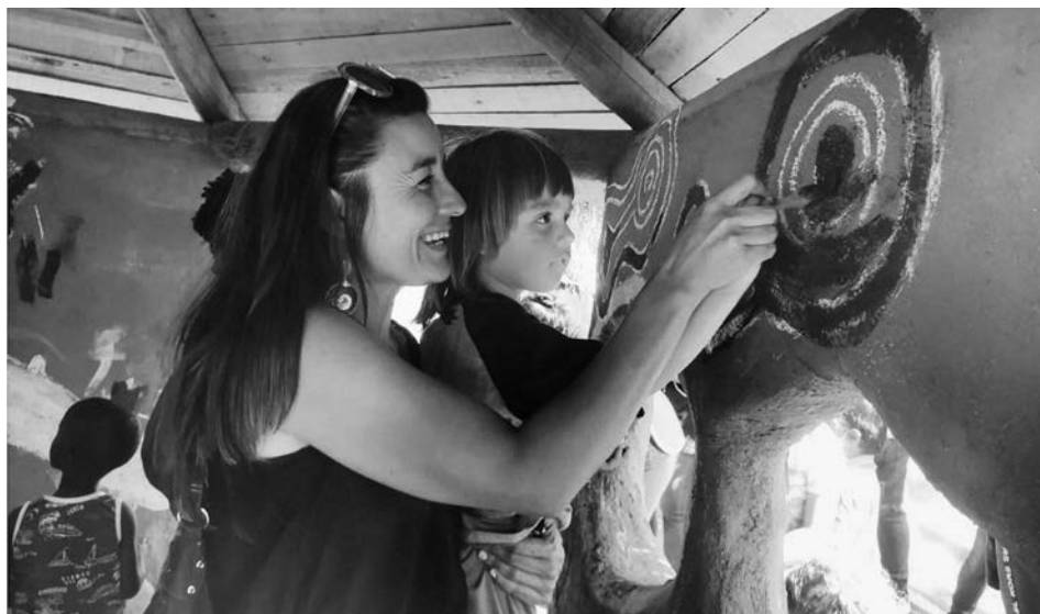
Imagen 13. Jardín Infantil Inti Raymi Nota. Fotografía del centro educativo

Esta revisión a la práctica educativa del Jardín infantil Inti Raymi, ha evidenciado cómo desde los diversos actores y componentes de los sistemas educativos, es posible abordar la ciudadanía desde la primera infancia. No obstante, para alcanzar dicho objetivo, es necesario que el equipo educativo trabaje con responsabilidad, colaborativamente, con vocación, en armonía, y, además, con la capacidad de desarrollar una reflexión crítica, efectiva y permanente sobre su quehacer y sus experiencias. De esta forma, actualizan su mirada sobre la construcción de la otredad diversa, pero principalmente, enriquecen su labor pedagógica acorde a las necesidades específicas de los niños, niñas y sus familias.