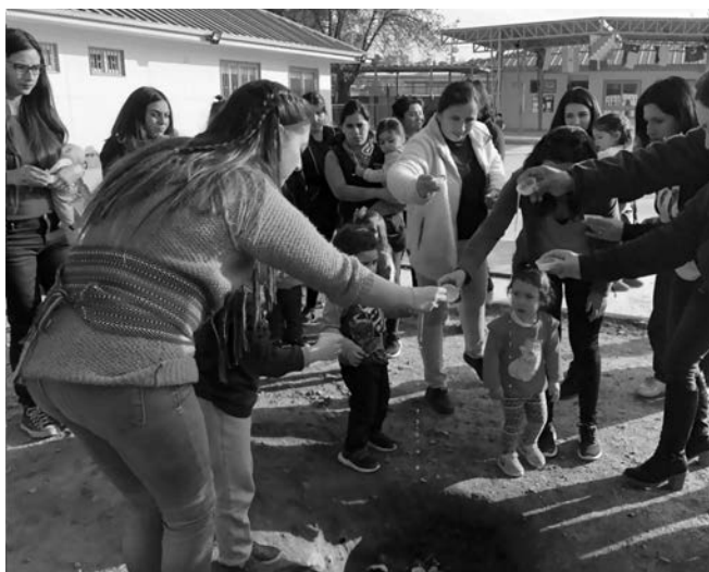
Imagen 10. Jardín Infantil Inti Raymi Nota. Fotografías del centro educativo

Desde el énfasis indígena de la cosmovisión andina, se incorporan los referentes filosóficos de Suma Qamaña: filosofía del buen vivir o “criar la vida” , la cual se basa en una relación armónica y respetuosa entre seres humanos, y entre éstos y los otros seres vivos que cohabitan la naturaleza. En este sentido, Suma Qamaña es fundamentalmente un con-vivir armónico del género humano con su entorno natural, el mundo espiritual y las futuras generaciones (Farah, 2011).