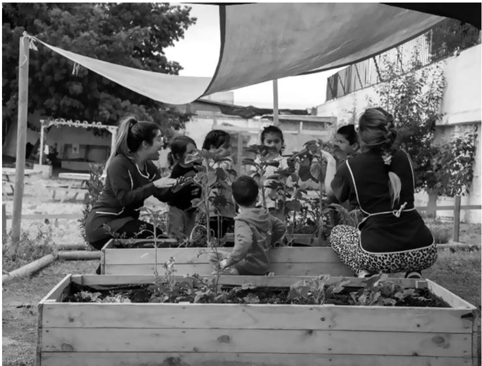
Imagen 4. Jardín Infantil Inti Raymi Nota. Fotografía del centro educativo

El año 2020, en el contexto de la Pandemia covid-19 y su consiguiente política de confinamiento, debieron reinventar su desafiante propuesta educativa a distancia. Desde allí y durante los años 2020 y 2021, confeccionaron Planes educativos para el hogar , que continuasen con el sello pedagógico del PEI, fortaleciendo el rol de las madres, padres y cuidadores como primeros educadores, potenciando estrategias parentales y los aprendizajes cotidianos dentro del hogar bajo la línea montessoriana.